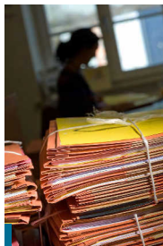
Jeder jeder Akte steht ein Mensch mit einer Geschichte. Deshalb muss jeder Fall individuell betrachtet werden.

In Bayern leben heute rund 1,5 Millionen Menschen mit Behinderung. Etwa 1,2 Millionen davon sind schwerbehindert. Das ist jeder elfte Bewohner in Bayern.