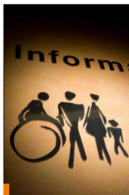
Nach der Erweiterung des Aufgabebereichs kommt sich das ehemalige Versorgungsamt nun auch um Familien

Mit der Einrichtung der Familienkassen bekommen die klassischen Aufgabengebiete des Versorgungsamtes 1986 Zuwachs. Um die Erweiterung nach außen hin sichtbar zu machen, erfolgt eine Umbenennung der bayerischen Versorgungsämter. Seit 1991 heißen sie Ämter für Versorgung und Familienförderung (AVF).