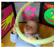
Die sehgeschädigte Kinder die Welt nicht mit den Augen kennenlernen können, ist die haptische und akustische Erfahrung umso wichtiger. www.zbfbs.de

Nach dem Zweiten Weltkrieg leben in Deutschland etwa 11.000 kriegsblinde Menschen, denen ein Entschädigungsanspruch nach dem Bundesversorgungsgesetz (BVG) zusteht. Für zivilblinde Menschen gibt es jedoch lange keine entsprechenden Ausgleichsleistungen. In Bayern trägt seit 1989 das Blindengeldgesetz zur Teilhabe von blinden und heute auch taubblinden Menschen bei.