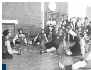
Kriegsopfer beim Behindertentag

70 Jahre nach Ende des Zweiten Weltkrieges erhalten in Bayern noch mehr als 22.000 Bürger Leistungen nach dem Bundesversorgungsgesetz in Höhe von rund 128 Millionen Euro (2014).