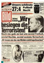
Die Bild-Schlagzeilen beziehen sich auf die Regierungserklärung vom 18. September 1977 in der Bundeskanzler Helmut Schmidt verkündet, dass seine Regierung zur Bekämpfung der RAF-Terroristen alle Möglichkeiten des Rechtsstaates ausschöpfen werde.

2014 hat das ZBFS Opfer von Gewalttaten mit Hilfen in Höhe von über 21 Millionen Euro unterstützt.