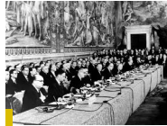
Am 25. März 1957 wird in Rom der Vertrag zur Gründung der Europäischen Wirtschaftsgemeinschaft (EWG) unterzeichnet.

Im Kalenderjahr 2014 haben die Stiftungen insgesamt etwa 17 Millionen Euro an Leistungen ausgeschüttet, die Menschen in besonderen Lebenssituationen zugute kommen.