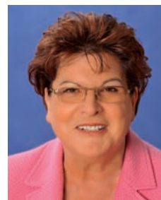
Barbara Stamm Präsidentin des Bayerischen Landtags

Wir freuen uns deshalb sehr, in diesem Jahr zum fünften Mal private Betriebe und öffentliche Dienststellen auszeichnen zu können, die sich bei der Beschäftigung von Menschen mit Behinderung besonders hervorgetan haben. Im Rahmen einer Feierstunde wird dieses besondere Engagement angemessen gewürdigt werden.