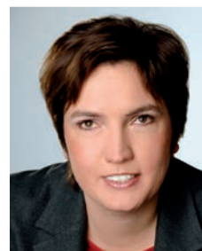
Irmgard Badura Beauftragte der Bayerischen Staatsregierung für die Belange von Menschen mit Behinderung